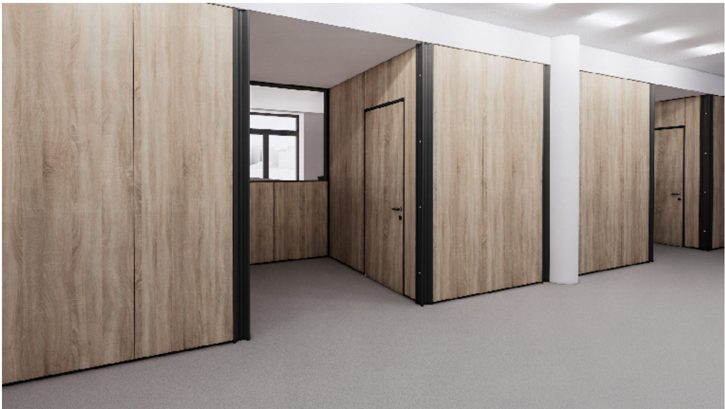
2NP - PŘEPÁŽKOVÁ PRACOVIŠTĚ, OSOBNÍ DOKLADY - POHLED Z HALY

VÝŠKOVÝ SYSTÉM Bpv, SOUŘADNICOVÝ JTSK ±0,000 = 251,28m N. M.