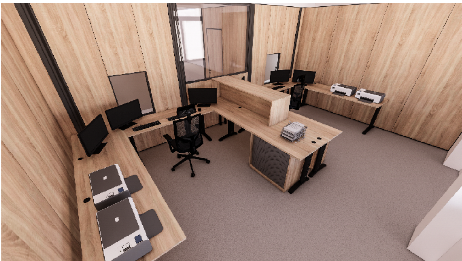
2NP - PŘEPÁŽKOVÁ PRACOVIŠTĚ, OSOBNÍ DOKLADY - ZÁZEMÍ